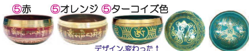
デザイン, 変わった↑